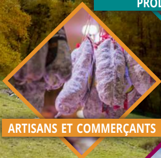
ARTISANS ET COMMERÇANTS