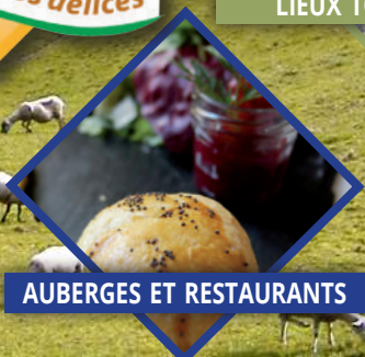
AUBERGES ET RESTAURANTS