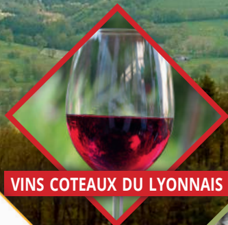
VINS COTEAUX DU LYONNAIS